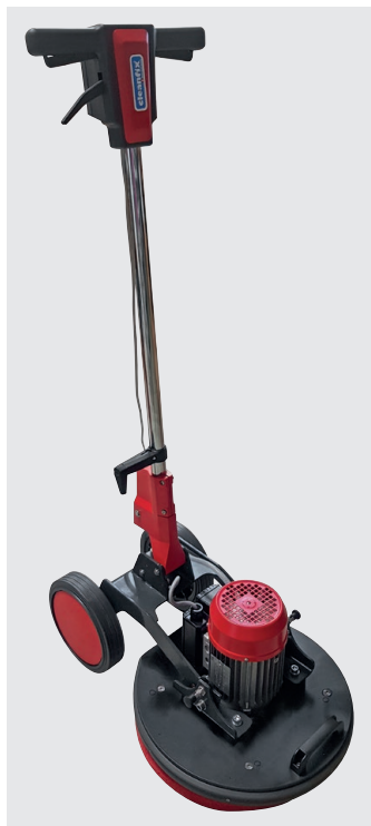
E44 Excenter Contenu de la livraison

Le réglage breveté de la poignée et les grandes roues pour un transport facile sont de grands avantages. Les deux goupilles d'arrêt (750.586 Kit de goupilles d'arrêt) situées sur le corps sont également utiles. Elles permettent de 1. soulever les roues du sol pour ne pas laisser de traces de roulement ou 2. de retourner complètement le timon pour obtenir un poids maximum sur le sol. Vous pouvez adapter parfaitement le poids de la machine à votre application en ajoutant des poids supplémentaires. Il suffit de régler la tête de brosse de l'Excenter E44 et vous pouvez facilement changer les disques ou ranger la machine.