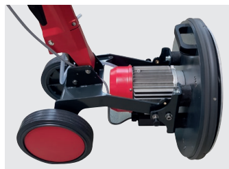
Tête de brosse montée pour un rangement optimal