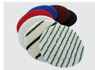
Large gamme de pads

Siège principal Cleanfix Reinigungssysteme AG Stettenstrasse 15 | 9247 Henau-Uzwil/SG Tel. 071 955 47 47 | info@cleanfix.com | www.cleanfix.ch