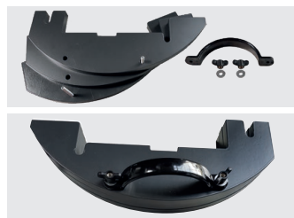
Poids facilement adaptables (accessoires optionnels)