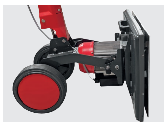
Bürstkopf aufgestellt für die optimale Lagerung