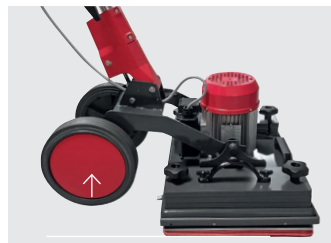
Räder vom Boden abheben um keine Laufspuren zu hinter- lassen