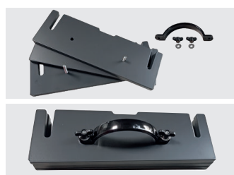
Gewichte einfach adaptierbar (Sonderzubehör)