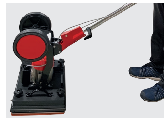
Deichsel auf Kopf stellen für maximales Arbeitsgewicht