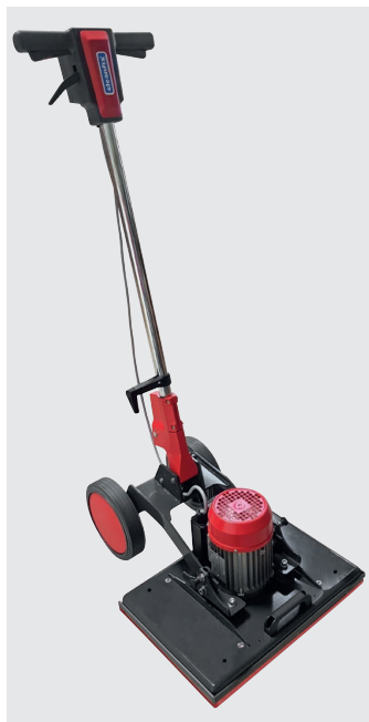
E50x35 Excenter Lieferumfang

Durch die viereckige Konstruktion kommen Sie perfekt in jede Ecke. Unsere patentierte Stielverstellung sowie die grossen Räder für den einfachen Transport sind bedeutende Vorteile. Von Nutzen sind auch die zwei Rasten (750.586 Kit Rastbolzen) auf dem Gehäuse, mit denen Sie entweder die Räder vom Boden abheben um keine Laufspuren zu hinterlassen oder die Deichsel komplett auf den Kopf stellen können um ein maximales Gewicht auf den Boden zu bekommen. Durch gestückelte Zusatzgewichte können Sie das Maschinengewicht perfekt Ihrer Anwendung adaptieren. Stellen Sie den Bürstkopf von der E50x35 Excenter einfach auf und Sie können die Pads bequem wechseln oder die Maschine optimal lagern.