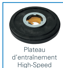
Plateau d'entraînement High-Speed