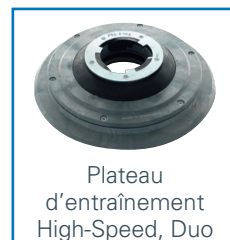
Plateau d'entraînement High-Speed, Duo