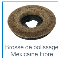
Brosse de polissage Mexicaine Fibre