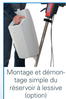
Montage et démontage simple du réservoir à lessive (option)