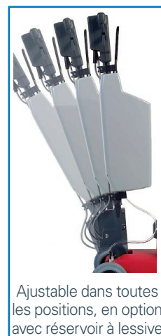
Ajustable dans toutes les positions, en option avec réservoir à lessive