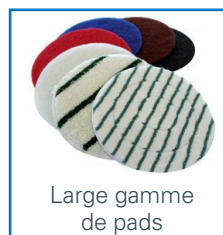
Large gamme de pads