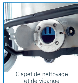
Clapet de nettoyage et de vidange