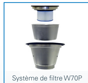
Système de filtre W70P