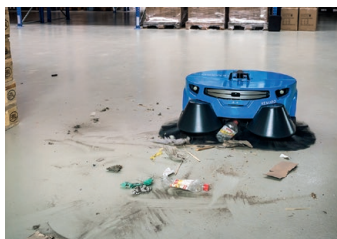
Nettoie les saletés grossières

Le Kemaro peut être facilement transporté et utilisé dans plusieurs bâtiments ou pièces. Grâce à des algorithmes sophistiqués et à l'intelligence artificielle, le robot peut nettoyer de très grandes zones industrielles. Aucune installation supplémentaire n'est nécessaire pour le fonctionnement du robot balayeur. La navigation intelligente répond aux changements d'environnement sans guidage ni préprogrammation.