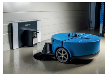
Station de recharge