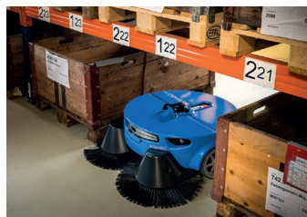
Nettoyage dans l'entrepôt de palettes