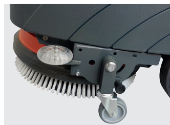
Transportrad für einfachen Transfer (optional)