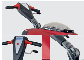
Ergonomischer Griff, verstellbar mit Handhebel

Mit dem cleveren Zubehör, wie dem Bürstenhalter oder dem Transportrad zum einfachen Transportieren und Parken der Maschine, haben Sie alles, was Sie brauchen.