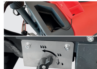
Einfüllöffnung Frischwassertank mit Wassermengenregler