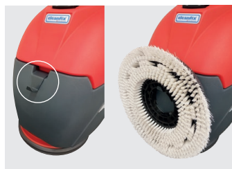
Bürstenhalter für Schrubbürste (optional)