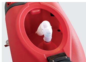
Grosser Schmutzwassertank mit effizientem Motorschutz dank Schwimmersystem