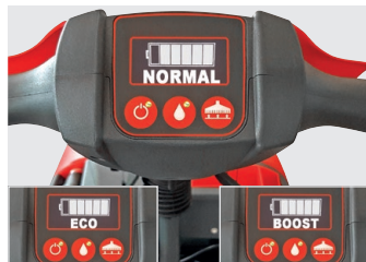
Digitale Anzeige 3 Saugleistungsstärken