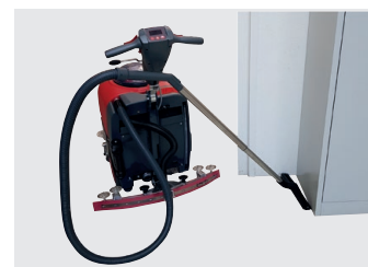
Wassersaug-Set mit Saugschlauch und Teleskoprohr (optional)