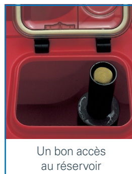
Un bon accès au réservoir